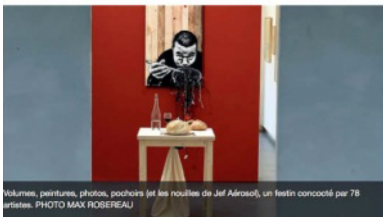
Volumes, peintures, photos, pochoirs (et les nouilles de Jef Aérosol), un festin concocté par 78 artistes.

Pour fêter ses 15 ans, l'espace d'art contemporain expose 94 œuvres sur le thème de la nourriture.