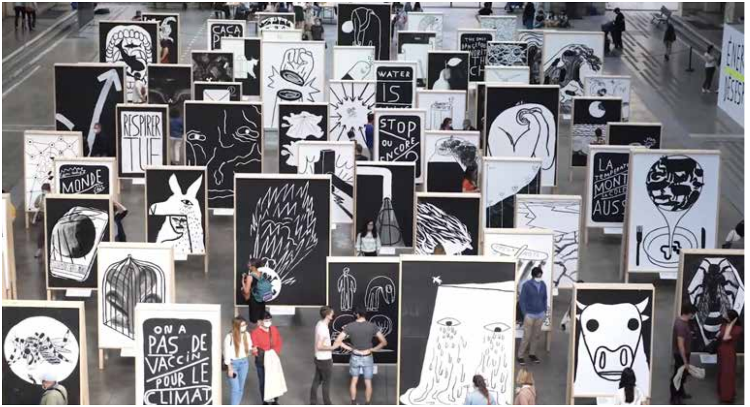
Exposition "ÉNERGIES DÉSESPOIRS" au 104Paris Encore heureux - École urbaine de Lyon - Bonnefrite