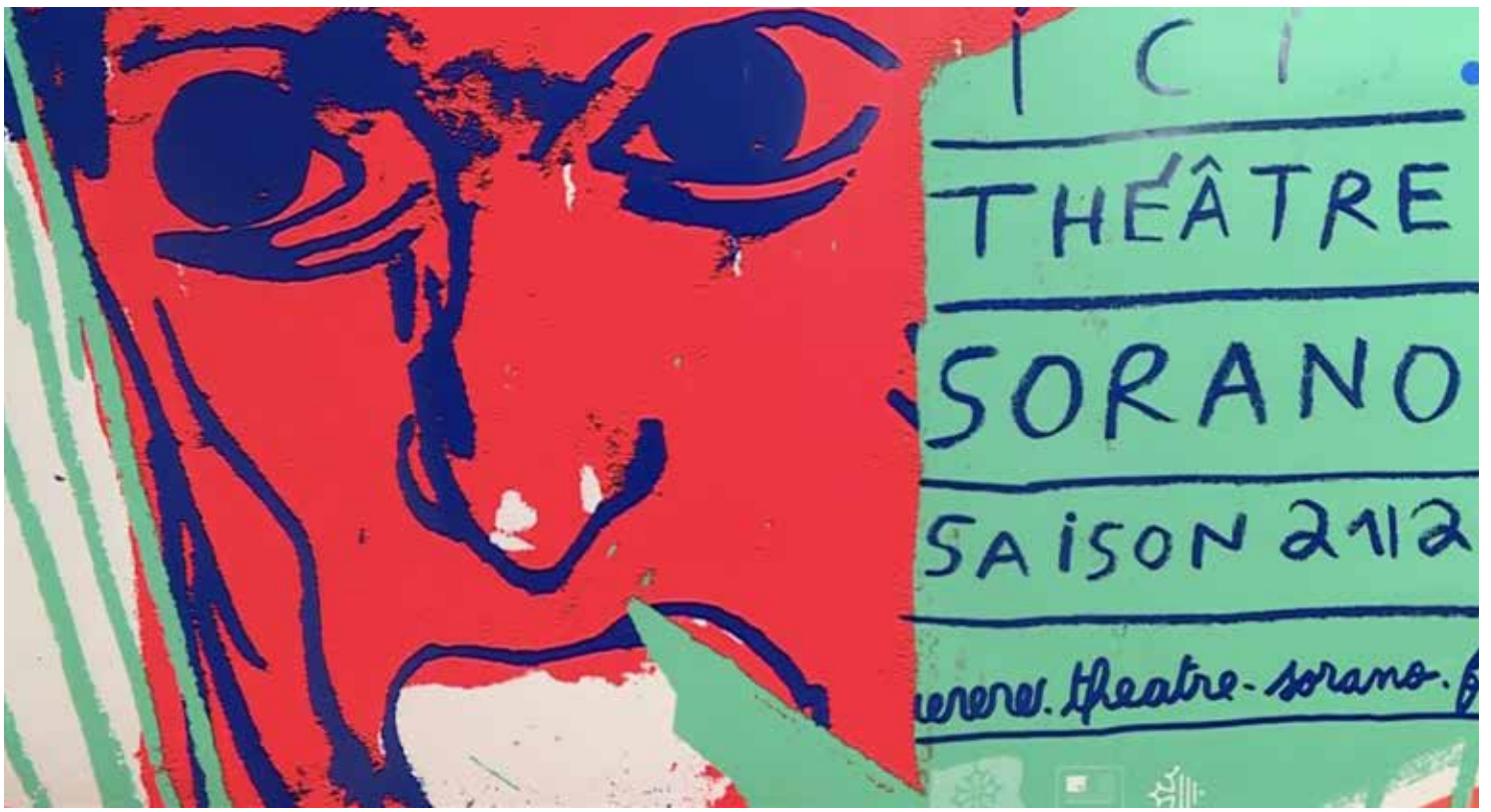
Exposition au Lieu-Commun de Toulouse