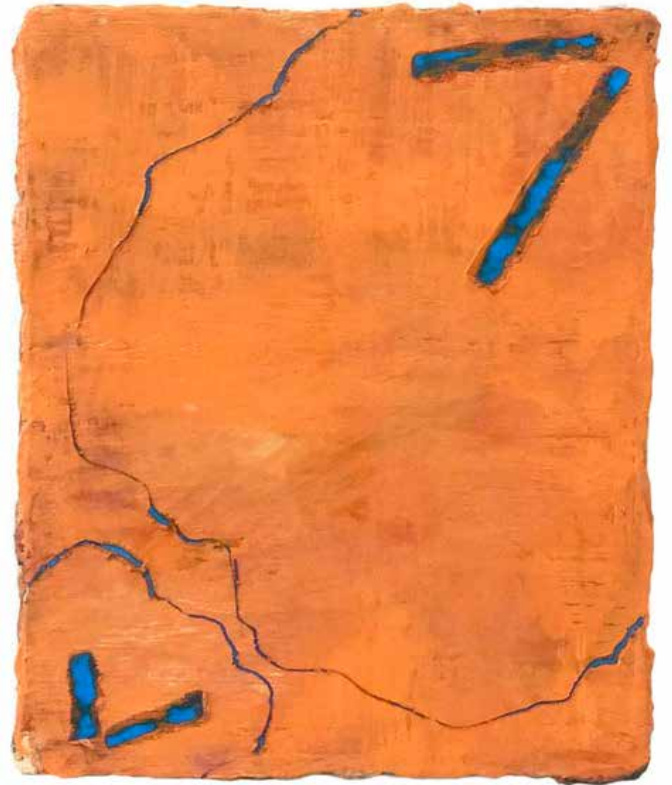
Orange, arbustes , 2023 - Huile/toile, 45 x 33 cm