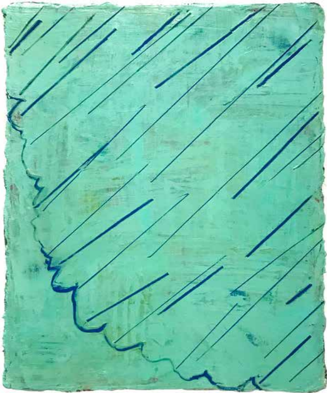
Vert, lac bleu , 2023 - Huile/toile, 45 x 33 cm