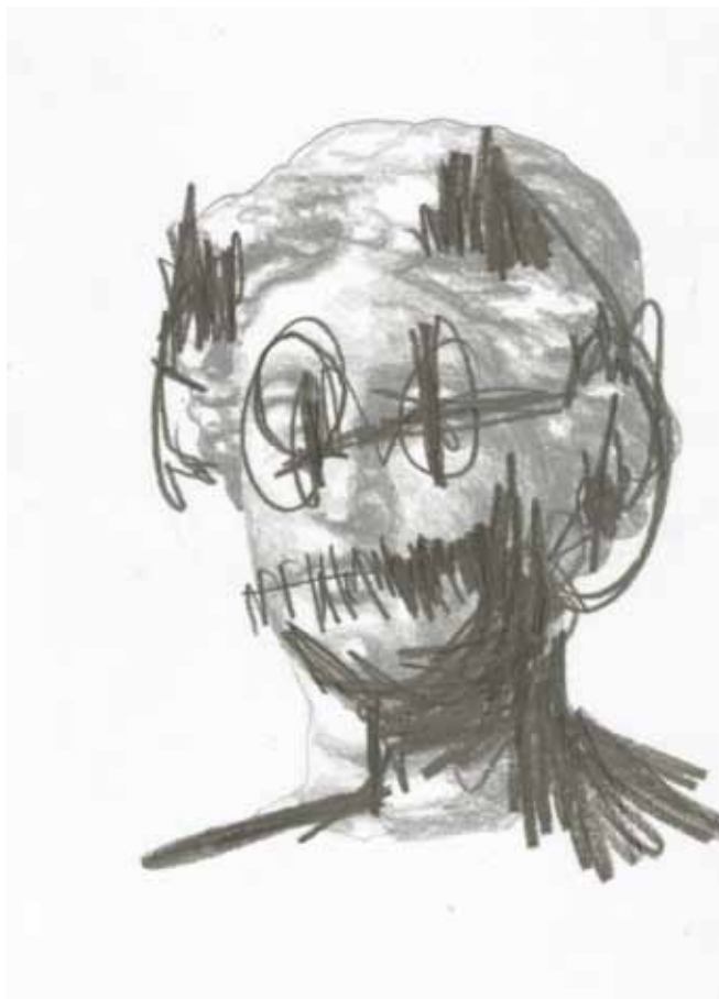
Frédéric Malette - Caligula, 2015 Graphite sur calque, 21 x 29,7 cm