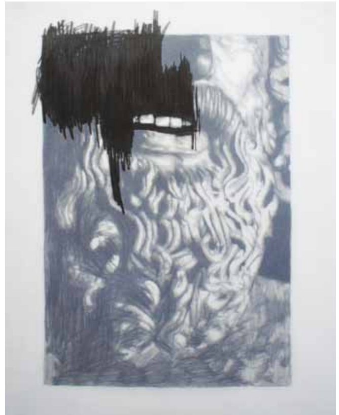
Frédéric Malette - Du vertige qui les perd, 2015 Graphite sur calque 180g, 50 x 70 cm