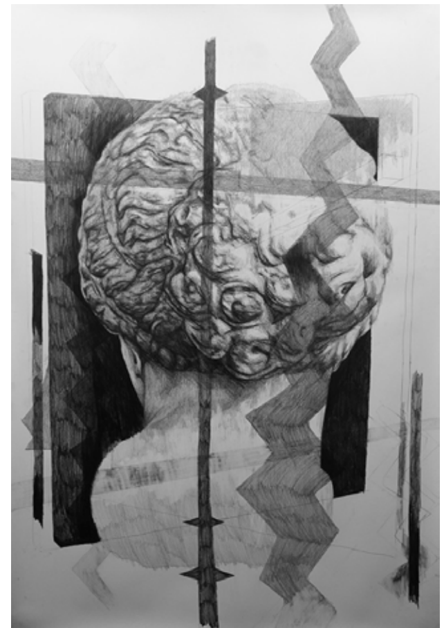
Frédéric Malette - D'une fureur de rêves, 2015 Graphite sur calque, 110 x 150 cm