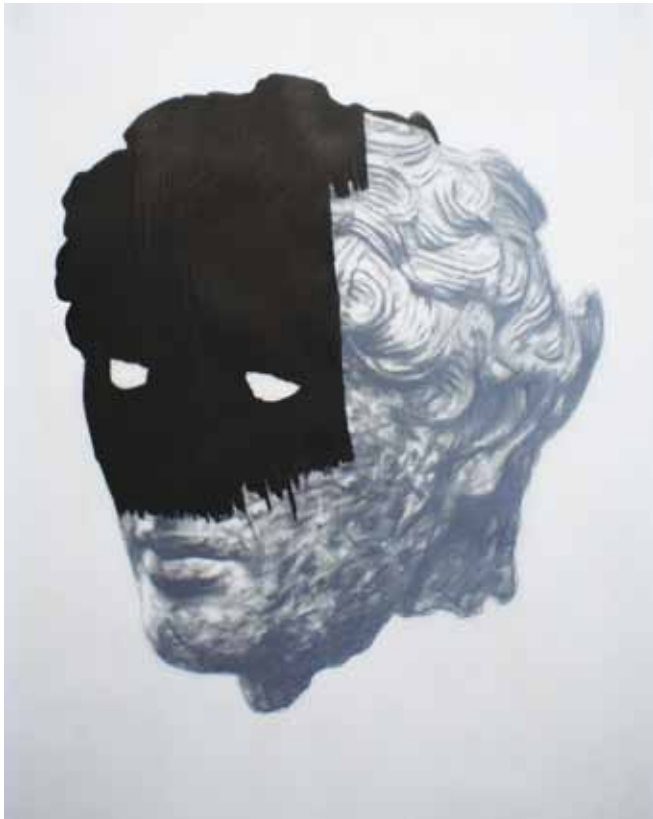
Frédéric Malette - De sombres fraternités, 2015 Graphite sur calque 180g, 50 x 70 cm