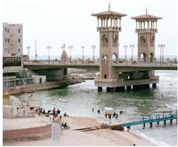
Alexandrie, Carte postale #26 - 2005 Tirage jet d'encre couleur - 122 x 100 cm