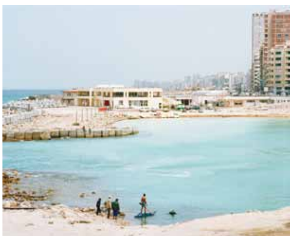
Alexandrie, Carte postale #13 - 2005 Tirage jet d'encre couleur - 122 x 100 cm

Lasécu 26 rue Bourjemois 59000 Lille - T. 03 20 47 05 38