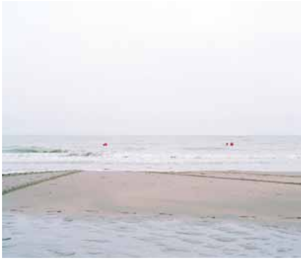
Bouées, Paysage #5 - 2006 Tirage jet d'encre couleur - 200 x 164 cm