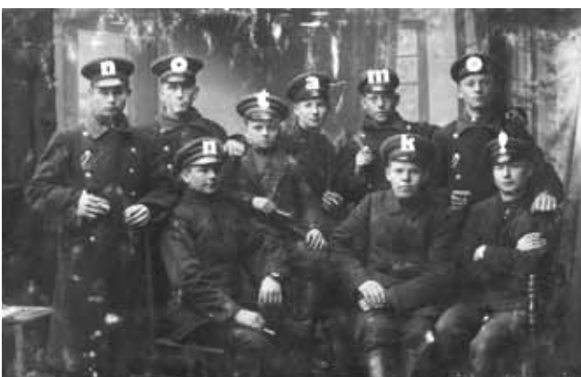
I CAN'T EXPLAIN, AFTER JONATHAN MONK Installation, 140 x 89,5 cm - 2012 Isabelle Le Minh