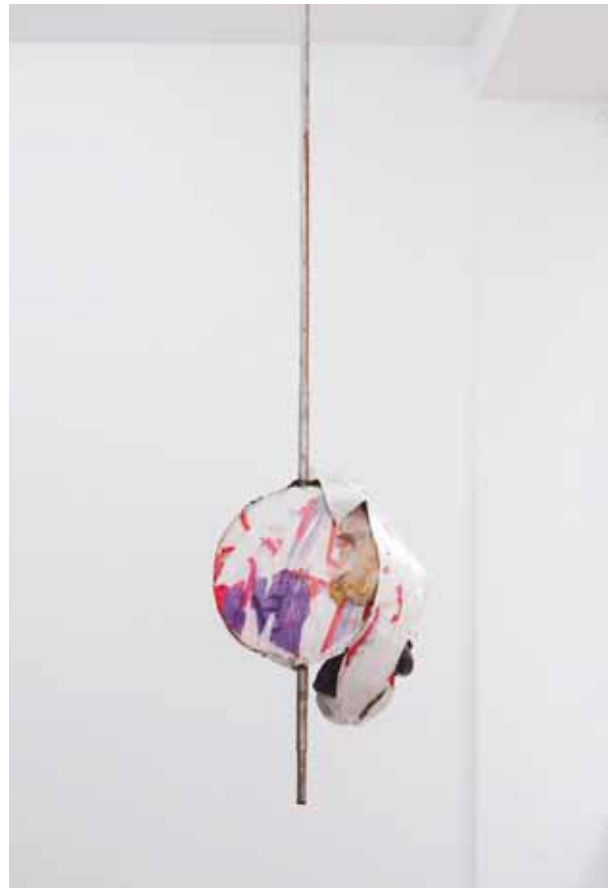
GLORY HOLE Installation, H 250 L 60 P 50 cm - 2013 David Douard

ment de travail que j'ai sous les yeux, je regarde les dates des uvres et celles de leur acquisition. Chacune marque une étape régulière d'un processus continu, exigeant. Chacune montre la régularité d'un cheminement commencé il y a trente ans et ne saurait s'interrompre. Le superbe Erró de 1977, acquis en 1983 marque le commencement. La photographie d'Isabelle Le Minh de 2012, acquise en 2014, marque la dernière étape. Au total quelque vingt-cinq pièces de grande qualité, marquant chacune à leur façon la singularité d'un propos, la dimension absolument libre des choix de notre ami.