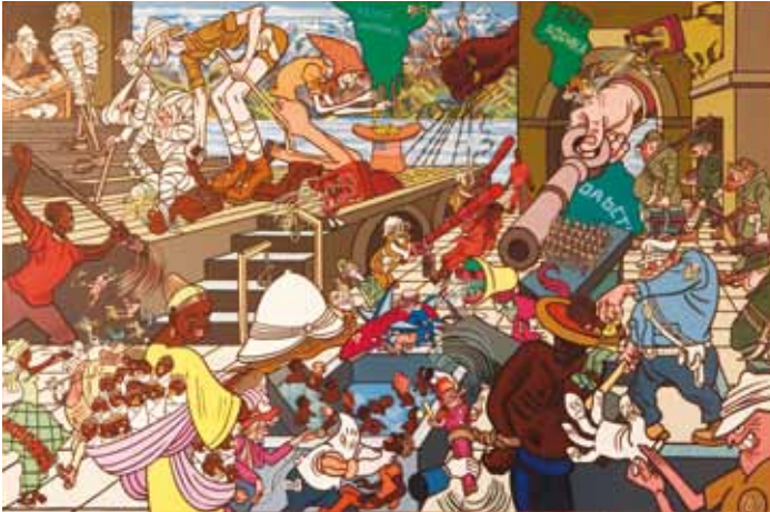
AFRICA série L'OUEST VU DE L'EST Peinture, 129 x 96 cm - 1977 ERRO