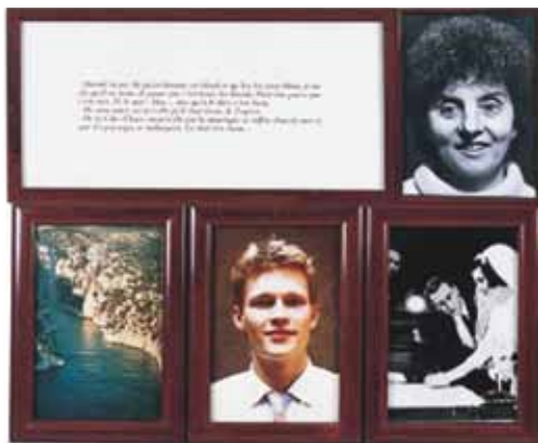
LES AVEUGLES Installation de photographies, 120 x 100 cm - 1986 Sophie Calle