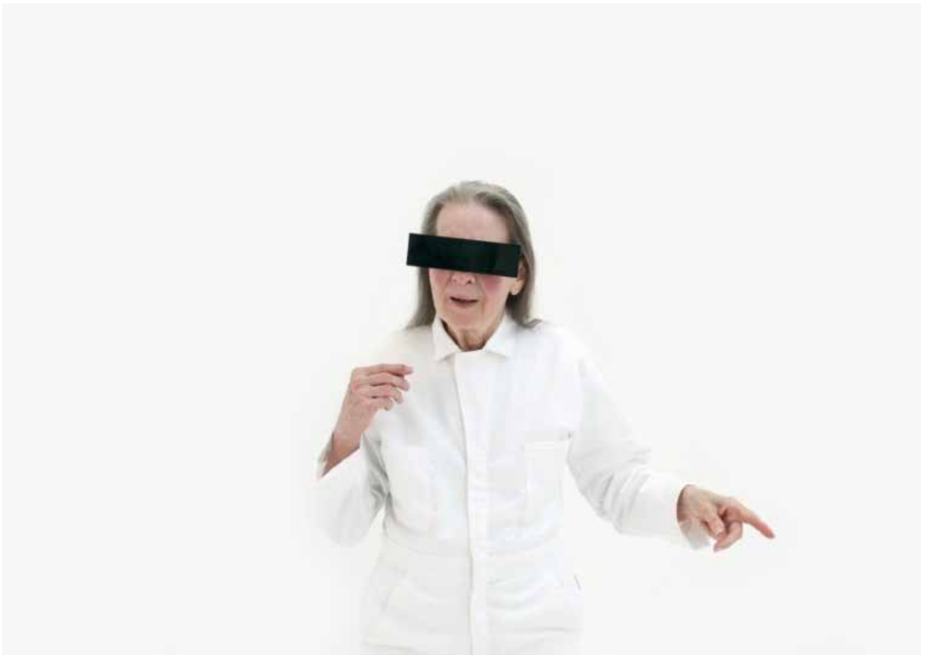
the italian method , 2016 - 4K video installation, 2 synchronized monitors, 11 minutes