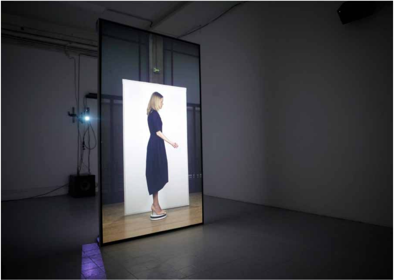
The Interview , 2017 - Vidéo Installation of 5 projections on screens (steel, projection screen, magnets)