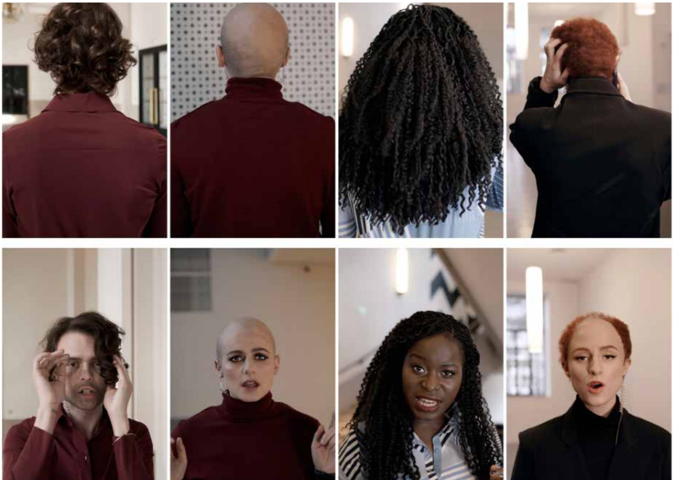
Just the four of us , 2018 - Installation vidéo HD de 4 écrans synchronisés – 5'20"