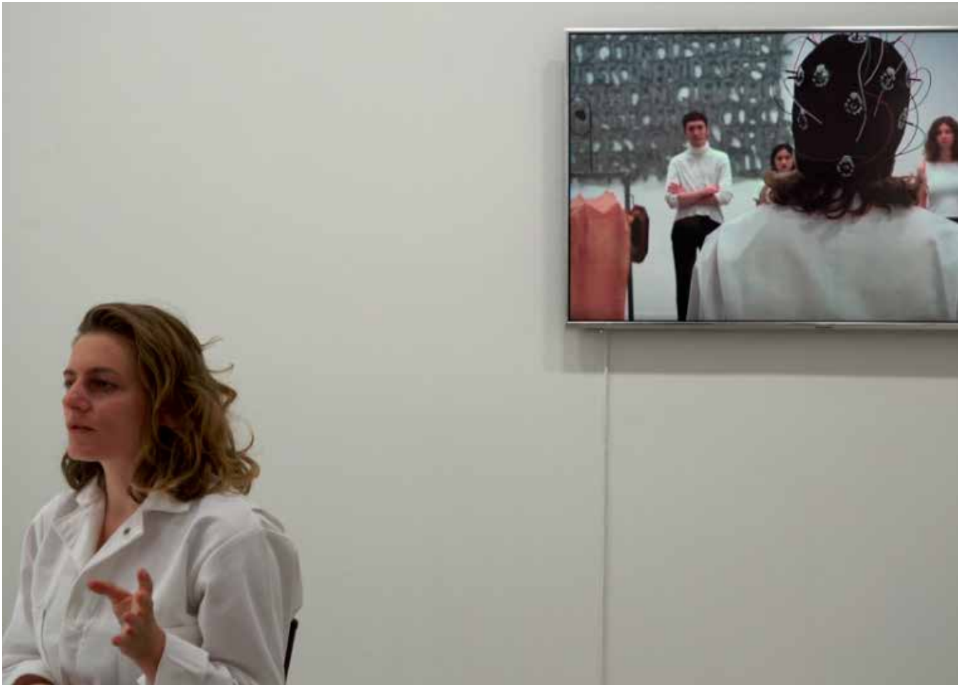
The Documentary , 2018 - Vidéo HD, 150