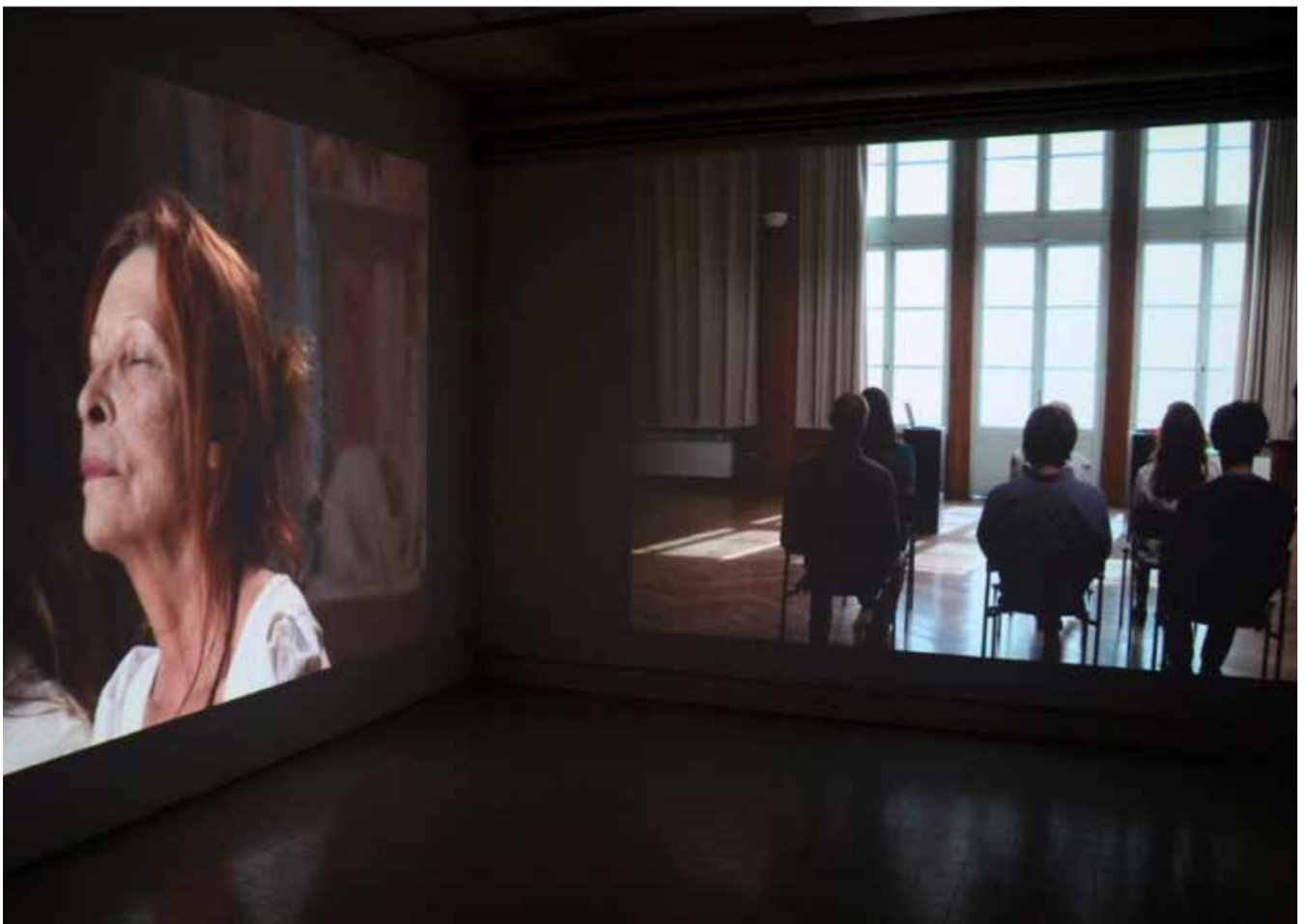
reality check - video installation with 3 synchronized projections of 41 minutes