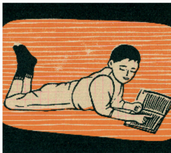
gravure sur linoléum