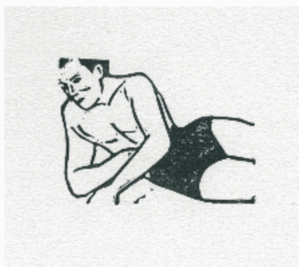
livre "les baigneurs" (gravure s/ gomme)