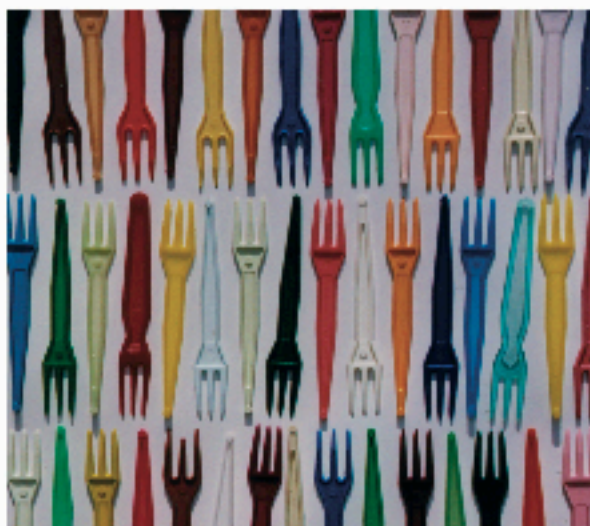
exposition "en veux-tu, en voilà"