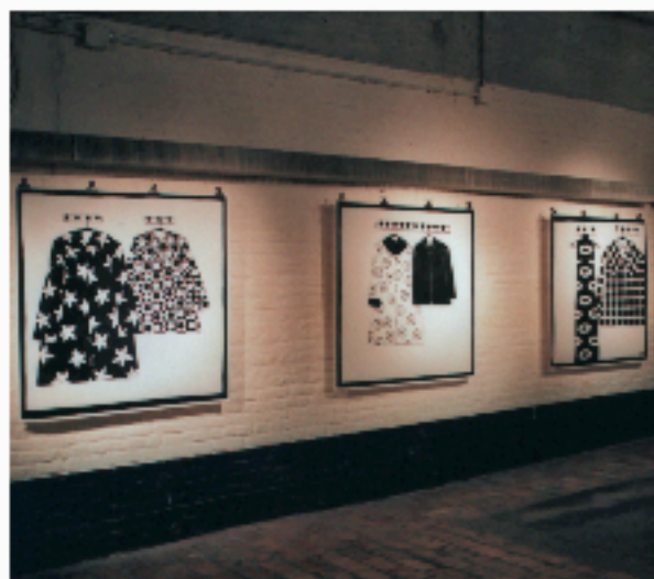
exposition à la P.P.G.M. à roubaix